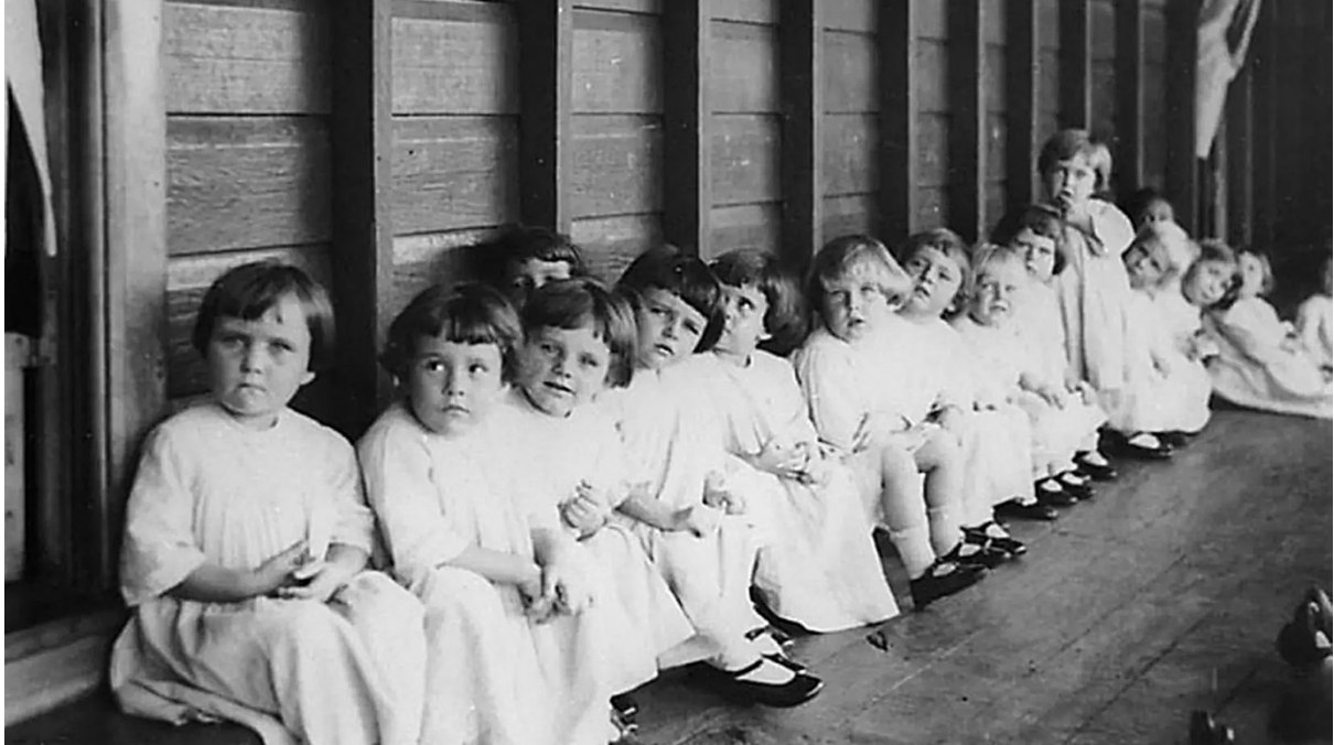
Bambini in attesa di adozione inviati nell'orfanotrofio Nidjee in Australia nel 1928

La Vera Storia sugli Scandali e Abusi dei Governi Irlandesi perpetrati nei confronti delle Giovani Donne delle Case Magdalene e delle Case per la Madre e Figlio dal 1765 al 2023.