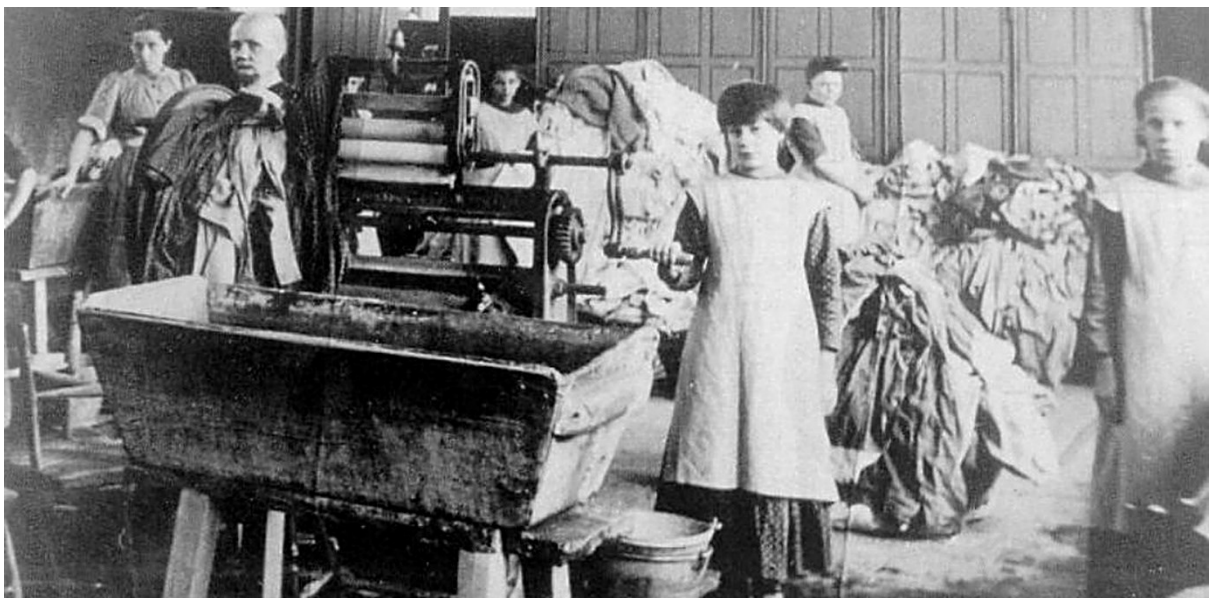
Giovani ragazze in una "Magdalene Laundries" in Irlanda all'inizio del Novecento

Le condizioni all'interno di queste lavanderie erano di una crudeltà inimmaginabile. Non è possibile quantificare il numero preciso di ragazze e giovani donne confinate in queste strutture; dagli archivi disponibili risulta che almeno diverse decine di migliaia di esse furono arrestate secondo la legge irlandese e quindi tradotte dalle autorità nelle Case Magdalene per poi essere sottoposte ad un silenzio forzato, ad una sorveglianza incessante, ad abusi emotivi e fisici di una gravità inaudita. Molto spesso queste donne avevano l'unica colpa di essere state violentate, di essere madri non sposate, oppure di essere prostitute. Talvolta erano donne condannate per piccoli crimini, come furti di modesta entità, e solo raramente anche per reati gravi come l'infanticidio [4].