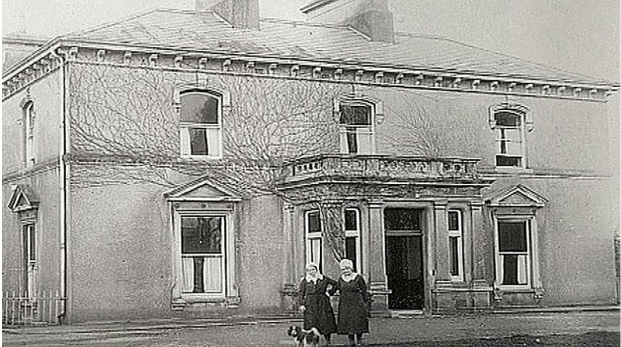
"Bethany Mother and Child Home" a Dublino, Irlanda, Unione Europea

La Vera Storia sugli Scandali e Abusi dei Governi Irlandesi perpetrati nei confronti delle Giovani Donne delle Case Magdalene e delle Case per la Madre e Figlio dal 1765 al 2023.