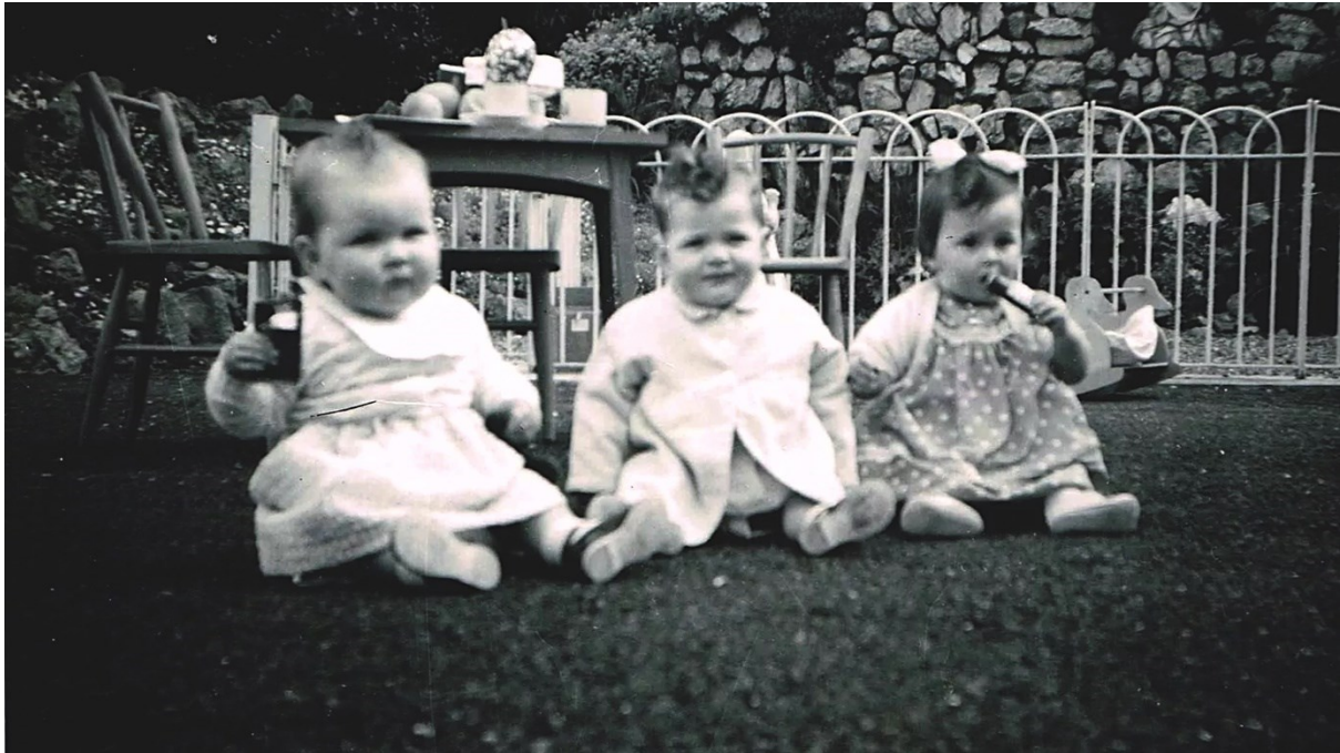
“Bessborough Mother and Baby Home”, Irlanda, Unione Europea

La Vera Storia sugli Scandali e Abusi dei Governi Irlandesi perpetrati nei confronti delle Giovani Donne delle Case Magdalene e delle Case per la Madre e Figlio dal 1765 al 2023.