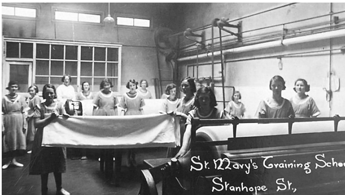
St Mary's Domestic Training Centre, Stanhope Street a Dublino, Irlanda, Unione Europea

Le ragazze e le giovani donne vennero imprigionate e furono costrette a lavorare gratuitamente principalmente nelle lavanderie, poiché queste istituzioni dovevano essere autosufficienti generando profitti; probabilmente anche per coloro che avevano interessi personali nell’esistenza di queste strutture.